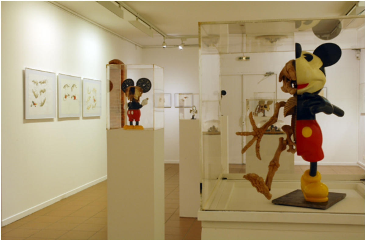
© Jean Bernard / Mickey is also a rat- Exposition Villa Tamaris, 2007.