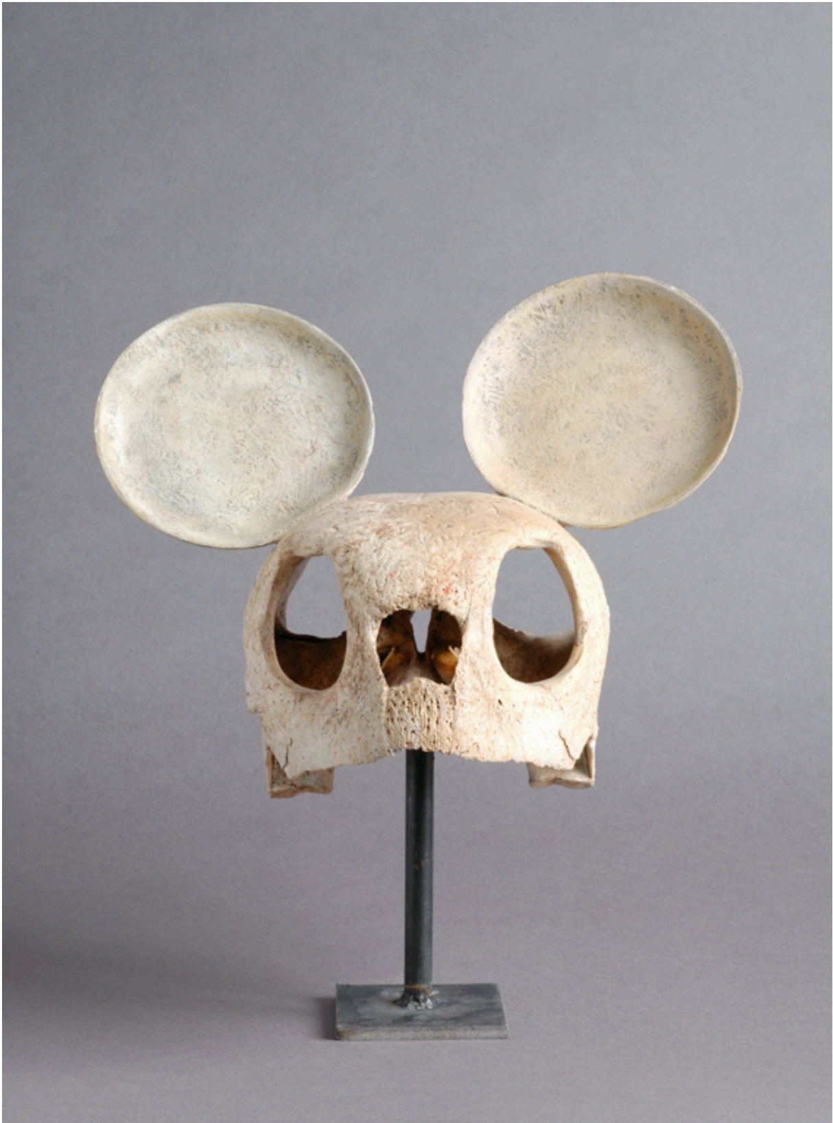
© Jean Bernard / Sans titre- Exposition Villa Tamaris, 2007.