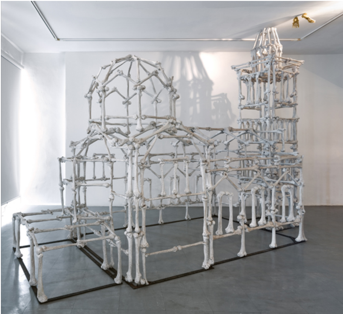
© Jean-Christophe Lett/ Notre Dame des os – Exposition Sauvés des eaux, CAC d'Istres, 2009.