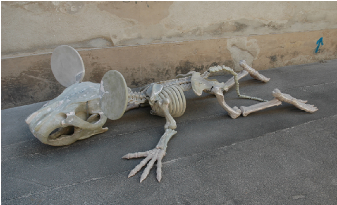
© Jean Bernard / Sans titre – Exposition Villa Tamaris, 2007.